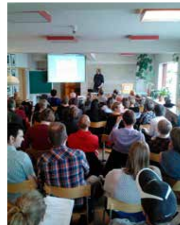
Fyrirlestrarnir hafa margir verið fjöl-sóttir.

var vonbrigði fyrir marga. En það voru líka vonbrigði hvað eftirmál hrunsins voru eyndarleg að mörgu leyti og afhjúpaði að róttækt vinstra fólks þyrfti skýrari eða meira afgerandi hugmyndir um aðra valkosti. Þetta endurspeglast kannski í því að „endurreisn“ var aðal slagorðið. Við sem höfum verið í vinstri pólitík höfum verið í vörn og kannski ekki verið nógu dugleg að sýna fram á aðra valkosti og tala af sannfæringu fyrir því að annað væri mögulegt. Heimur sem ekki stjórnast af kapitalisma.“